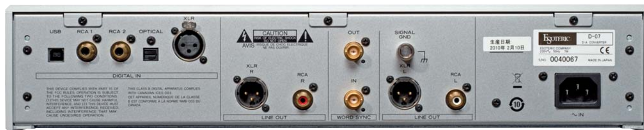
Le D-07 dispose de la connectique ad hoc pour répondre à toutes les configurations imaginables en entrée et en sortie.